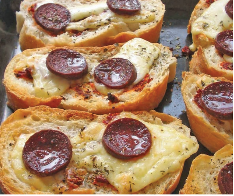
Sucuk, kahvaltılarının vazgeçilmez ürünlerinden biridir

masını önlemek, havayla ilişkisini keserek kokmasını ve bozulmasını engellemek, etin içindeki yağların oksitlenerek pastırma'yı acılaştırmasını önlemek gibi çok önemli işlevleri de vardır.