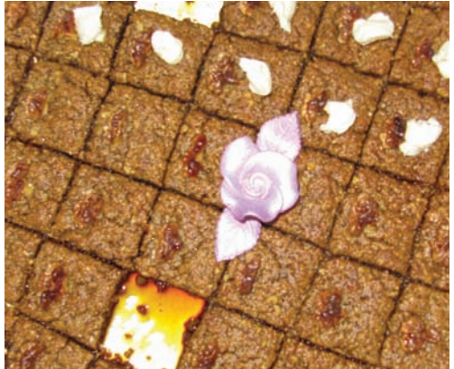
Kayseri mutfağından bir lezzet; Nevzine tatlısı

Doldurulan bağırsaklar bir müddet güneşte bekletilerek suyunu çekmesi sağlanır. Parmak