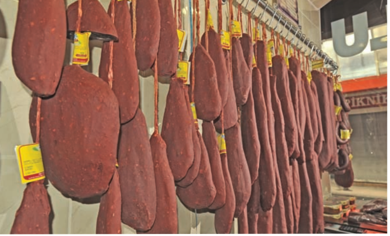
Kayseri mutfağının vazgeçilmez lezzetlerinden biri olan pastırma

özellikle yaz aylarında sebzedden yapılan bir yemektir. Ana malzemesini, patlıcan, domates, biber, sarımsak ve et oluşturur. Buna patates ilave edildiği de olur.