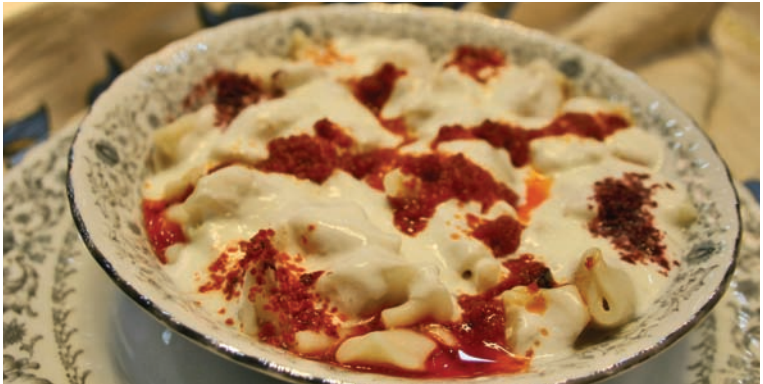
Mantı, Kayseri mutfağının simge yemeklerinden biridir

dınlar tüm marifetlerini gösterir. Kesilen hamurlar, birer birer alınır, içine nohut tanesinden biraz küçük kıyma parçası konur, her iki elin baş ve işaret parmakları arasında uçlar yanlarda biraz pay bırakılır birleştirilir. Mantı suda kaynatılarak pişirilir. Kaynama süresi çok önemlidir. Tereyağ ile hazırlanan sos mantıya ilave edildikten sonra üzerine sarımsaklı yoğurt konur. Daha sonra isteğe göre sumak ve nane ilave edilir.