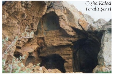
Çeşka Kalesi Yeraltı Şehri

arkaya dizilmiş bu yapılar geç dönem Osmanlı resim sanatının özgün örnekleriyle bezenmiştir. Ancak yapılan onarımlarda bu resimlerin çoğu yok olmuştur. Mahfilin ikinci katında yan kubbelerde yeşil, kırmızı, mavi ve sarının kullanıldığı çeşitli çiçek, yaprak ve meyve resimleri yer almaktadır.