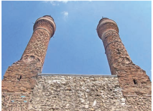
Selçuklular tarafından 1271 yılında yaptırılan Çifte Minareli Medrese

Anadolu Selçuklularının önemli eserlerinden biridir. Selçuklu veziri Sahip Ata Fahrettin Ali tarafından 1271 yılında yaptırılmıştır. Taç kapı üzerinde yükselen tuğla örgülü iki minaresindeki mavi çinilerden dolayı bu adı almıştır. Plastik Sanatların şaheserlerinden biri olan taç kapıda mermer malzeme dikkat