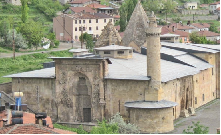
UNESCO tarafından "Dünya Mirası" listesine alınan Divriği Ulu Cami

çekmektedir. Taç kapının üst iki köşesinde iç içe girmiş hayvan motifleri yer almaktadır. Yapının giriş bölümünde sağda mescit, solda ise Darül-Hadis bölümü vardır. Avlunun kuzey ve güneyinde altı sütun üzerine inşa edilmiş, kemerli bir revak yer almaktadır.