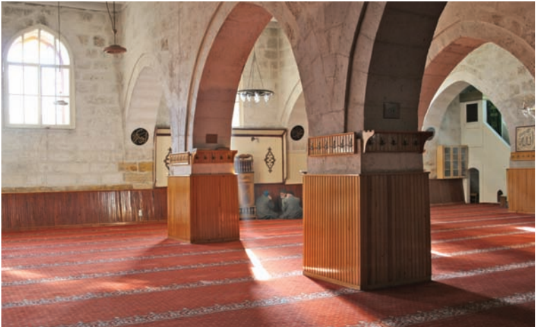
Selçuklular tarafından yaptırılan ve 50 adet yığma ayağı ile dikkat çeken Sivas Ulu Cami

yılında yapılan külliyyeden günümüze sâdece şifâhâne ulaşmıştır. Taç kapının sağındaki eyvanda Sultan I. İzzeddin Keykavus'un türbesi vardır. Kırmızı tuğladan yapılmış olan taç kapı firuze, mor ve beyaz çinilerle süslenmiştir. Dünyânın ilk akıl hastânesi kabul edilen bu medresenin iç bölümü mavi siyah çinilerle süslenmiştir.