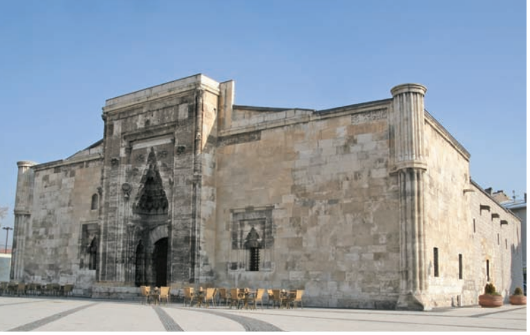
Taç kapısında Selçuklu taş işçiliğinin eşsiz örneklerinden birini sunan Buruciye Medresesi