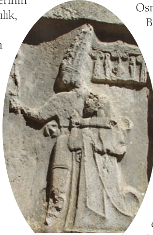
Ürgüp- Göreme yöresinde bulunan kaya kiliselerde yer alan bir fresk

Bizans Döneminde de önemli bir dini merkez olan Ürgüp, köy, kasaba ve vadilerindeki kaya kiliselerin ve manastırların piskoposluk merkeziydi. 11. yüzyılda Ürgüp, Selçuklular'ın önemli kentleri Konya'ya ve Niğde'ye açılan önemli bir kale konumundaydı.