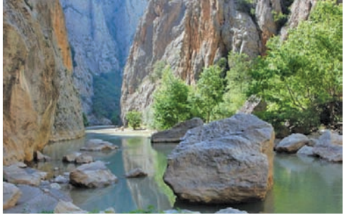
Doğal güzellikleriyle dikkat çeken Çamlık Milli Parkı

Yozgat-Sorgun karayolu üzeri Şahmuratlı Köyü sınırları içerisinde bulunmaktadır. Herodot tarihinde yer alan Medlerin Kerkenes Dağı üzerinde kurduğu Pteria şehrinin burası olduğu tahmin edilmektedir. M.Ö.600 yıllarında Medler tarafından kurulan şehrin, yaklaşık 7 km uzunluğunda sur duvarları ve 2,5 km 2 bir yerleşim alanı vardır. Kaleye 8 giriş kapısından Kerkenes Antik Şehir Pteria'da bulunan hayvan kabartmalar