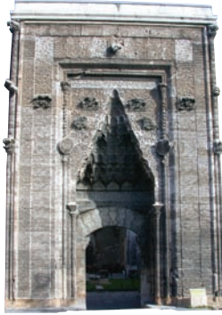
Şifahiye Medresesi taç kapısı

tarafından 1197 yılında yaptırılmıştır. 31x54 m ölçülerinde ve yaklaşık 1674 m 2 lik bir alana oturan dikdörtgen planlı caminin üst örtüsü düz dam şeklindedir. Güney duvarına dik olarak uzanan 11 sahnlı asil ibadet alanında 50 adet yığma ayak bulunmaktadır. Caminin eğriliğiyle ünlü çini bezemeli tuğla minaresi 1213 yılında yapılmıştır.