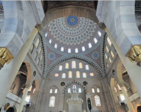
Süslemeleriyle göz kamaştıran Bûrüngüz Camisi'nin iç bölümü

bölümün üzerinde küçük kubbeler yer almaktadır. Yapının doğu ve batı köşelerinde birer şerefeli iki minaresi bulunmaktadır. Caminin doğu ve batı yönünde iki girişi vardır. Bu girişlerin iki yanındaki kapı açıklığıyla mahfil katına çıkılmaktadır. Minber ve mihrabı mermer kaplı cami, kesme taştan yapılmıştır.