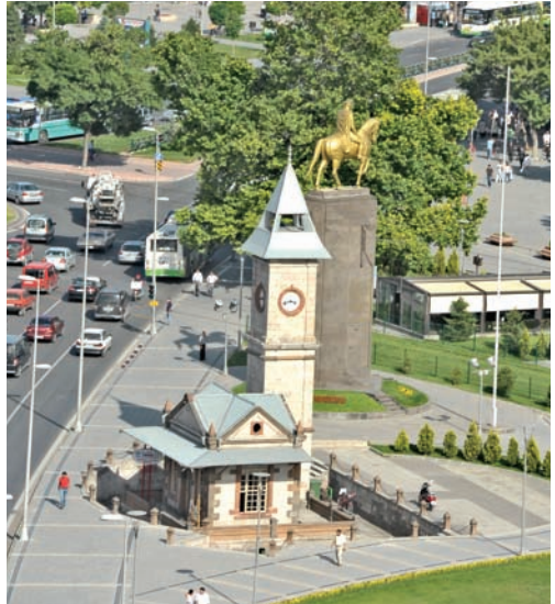
Cumhuriyet Meydanı'nda bulunan Saat Kulesi ve Atatürk heykeli

Cumhuriyet meydanında bulunan Saat Kulesi, 1906 yılında II. Abdülhamit'in emriyle Tavlusunlu Salih Usta'ya yaptırılmıştır. Saat Kulesi'nin yanındaki dikdörtgen mekân ise muvakkithane (saat odası) olarak inşa edilmiştir. Mustafa Kemal Paşa'nın Kayseri'ye geldiğinde halka hitap etmek için kullandığı bu bina, bir dönem Anadolu ve Rumeli Müdafaa-i Hukuk Cemiyeti'nin Kayseri