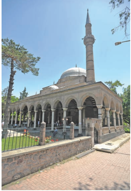
Mimar Sinan tarafından 1573 yılında yaptırılan Kurşunlu Camisi

Mimarisi: Düzgün kesme taştan inşa edilmiş kare planlı bir yapıdır. Caminin tek mekanı örten kubbesi köşelerdeki ayaklara oturmaktadır. Avlu duvarları sonradan inşa edilen caminin tek şerefeli minaresi orjinaldir. Caminin son cemaat yeri, Mimar Sinan