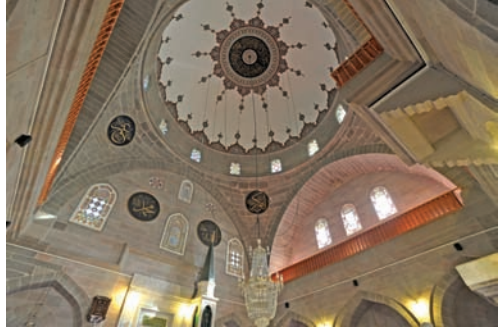
Gösterişli ve ferah iç mekanı, süslemeleri ile de dikkat çekmektedir

Klasik Osmanlı mimari eseri olan Kurşunlu Cami, kalem nakışları ve süslemeleri bakımından