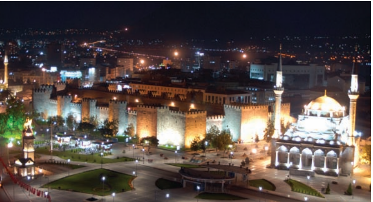
Kayseri Kalesi, Saat Kulesi ve Bürüngüz Camisi'nin yer aldığı Cumhuriyet Meydanı