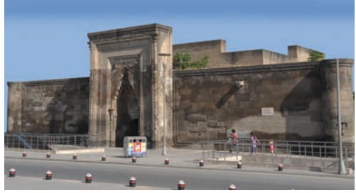
Günümüzde çarşı olarak hizmet veren Sahabiye Medresesi

Taçkapı, iki tarafında geometrik şekiller ile işlenmiş üç geniş şerit ve onun dışında yukarıdan aşağıya bir sıra mukarnas ve dış kenarlarında da zikzaklı birer bitişik direk ile süslenmiştir. Taç kapı üzerinde beyaz mermerden kitabesi yer almaktadır. Medresenin dışındaki yollar bir metreye yakın yükseldiği için yapı