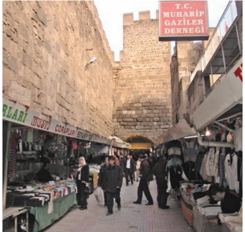
Kale içindeki çarşı

bulunmaktadır. İç kale surlarında Selçuklu yapılarından alınmış devşirme parçalar dikkati çeker. İç kalenin iki kapısı vardır. Doğuda Dizdar Kapısı, güneyde ise Altın