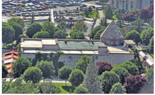
Avgunlu Medresesi, klasik Selçuklu mimarisini yansıtmaktadır

Avgunlu Medresesi, Gevher Nesibe Medresesi ve Şifahiyesi ile birlikte Mimar Sinan Parkı'nın içinde yer almaktadır. Kitabesi olmadığından kim tarafından yapıldığı ve yapım tarihi kesin olarak bilinmeyen yapı, 13'üncü yüzyıl Selçuklu dönemi eserlerinden biridir. Gevher Nesibe Medresesi ile arasında bir bağlantı olduğu bu sebeple de yaklaşık aynı tarihlerde inşa edildiği sanılmaktadır. Yapım tekniği ve kümbetin üst