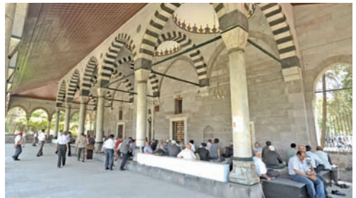
Kurşunlu Camisi'nin sivri kemerlerin taşıdığı san cemaat bölümü