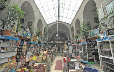
Günümüzde kitabevi olarak hizmet veren Avgunlu Medresesi

Mimarisi: Vakıflar Genel Müdürlüğü'nce restore edilen medrese; Tek katlı, iki eyvanlı, revaklı avlulu, asimetrik bir plan arz eden, klasik Selçuklu özellikleri taşıyan bir yapıdır. Zaman içerisinde yapı kot seviyesinin altında kalmıştır. Medrese avlusuna merdivenlerle inilerek girilmektedir. Yapıya giriş, kuzey cephesinin ortasında yer alan, duvar yüzeyinden taşan, beşik tonozla örtülü taç kapıyla gerçekleştirilmiştir. Taç kapının yan