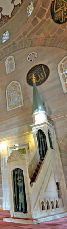
Kurşunlu Camisi'nin mimberi

oluşan Türkçe kitabesi bulunmaktadır. Caminin beden duvarlarının alt bölümlerinde güney ve kuzeyde ikişer, doğu ve batıda üçer pencere yer almaktadır. Bu pencereler dikdörtgen formlu ve sivri kemer alınlıklıdır. Bütün pencereler renkli camlarla