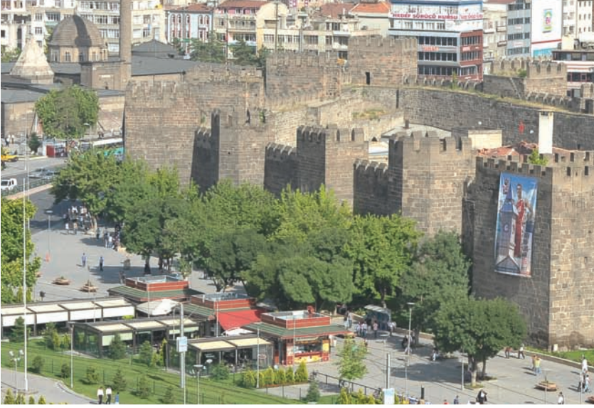
Cumhuriyet Meydanı'nı bütün ihtişamıyla süsleyen Kayseri Kalesi

Coğrafi ve stratejik konumu nedeniyle tarihin her döneminde önemini koruyan Kayseri, bu nedenle çeşitli saldırı ve işgallere maruz kalmıştır. Kayseri Kalesi, bu saldırılara ve işgallere karşı tedbir almak amacıyla inşa edilen şehirdeki en önemli yapıdır. Bugünkü Kayseri'nin ilk yerleşim yerlerini içine alan kale ve