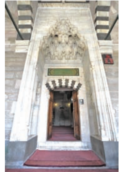
Kurşunlu Camisi'nin taç kapısı

Kayseri'nin en güzel camilerinden biridir.