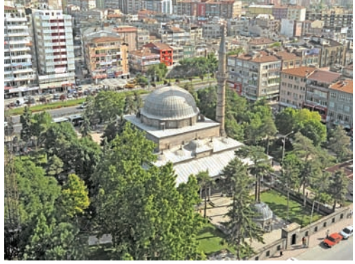
Caminin, isminin de kaynağı olan, kurşunla kaplı kubbesi

süslüdür, mihrabın üzerindeki ise camiye zengin bir hava katar. Caminin minber, mihrap