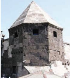
Lala Muslihittin tarafından yaptırılan kümbet

Mimarsinan Parkı: Yaklaşık 150 bin m2 alana oturan Mimar Sinan Parkı içerisinde 4 bin metre karelik 2 havuz, anfiteatro, 300 adet oturma grubu ve çocuk oyun alanları bulunmaktadır.