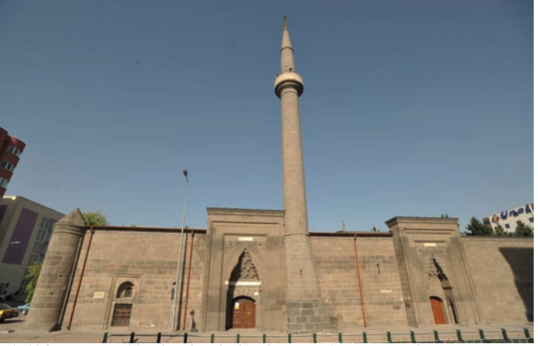
Selçuklular'ın Kayseri'deki şaheserlerinden biri olan Hacı Kılıç Cami ve Medresesi

Gevher Nesibe Mahallesi ☑ Her gün ☎ +90 352 222 20 88 📱 📺