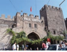
İç Kale'nin giriş kapılarının biri

Günümüzde küçük esnafların yer aldığı kale içi, yakın bir zamanda yerini Kayseri Büyükşehir Belediyesi tarafından projelendirilen bir kültür-sanat merkezi ve müzeye bırakacak