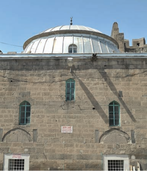
İç Kale'de bulunan Kale (Fatih) Camisi