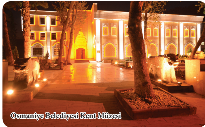
Osmaniye Belediyesi Kent Müzesi

Osmaniye, Akdeniz Bölgesi'nin ve Çukurova'nın doğusunda yer alır. Ulaşım açısından çok avantajlı konumdadır. TEM Otoyolu , D-400 Karayolu ve tren yolu şehrin merkezinden geçmektedir. Adana, Gaziantep, Hatay ve Kahramanmaraş illerine komşudur. Verimli toprakları, ılıman iklimi , denize yakınlığı, dağları, yaylaları, baraj gölleri, akarsuları , kaplıcaları , kaleleri, kültür ve tabiat varlıklarıyla alternatif turizm imkanlarını bir arada bulunmaktadır.