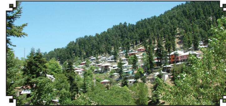
Kadiri Bağdaş Yaylası