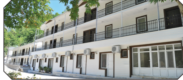
Düziçi İlçesi Haruniye Kaplıcası

Yaylacılık ilimiz kültüründe önemli yer oluşturmaktadır. İlimizi çevreleyen Orta Toros Dağlarında ve Amanos Dağı üzerinde irili ufaklı 43 yayla bulunmaktadır. Zorkun yaylası Çukurova'nın en büyük yaylalarındandır.