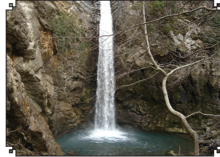
Osmaniye Karaçay Şelalesi