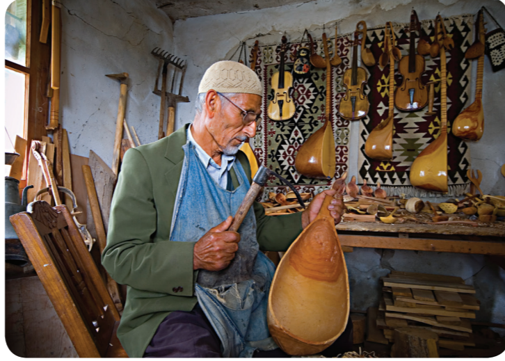
Ahşap işçiliği geleneksel el sanatlarındandır.