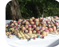
Kirişteğ ( Topaç)