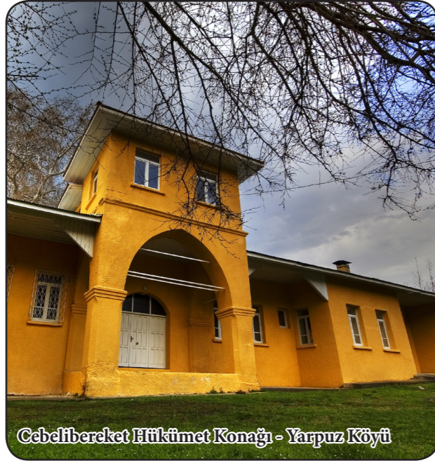
Cebelibereket Hükümet Konağı - Yarpuz Köyü