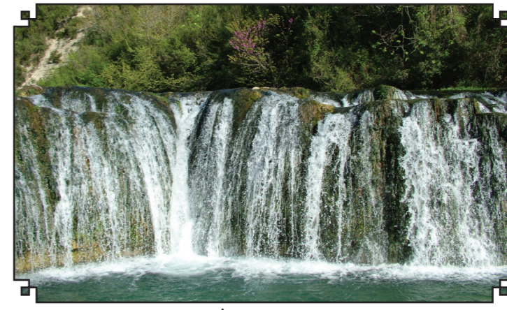
Sumbas İlçesi Şarлак Şelalesi