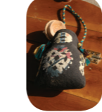
Hızman - hamzan