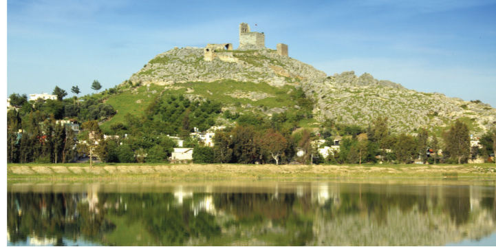
Hemite (Gökçedam) Kalesi ve Ceyhan Nehri