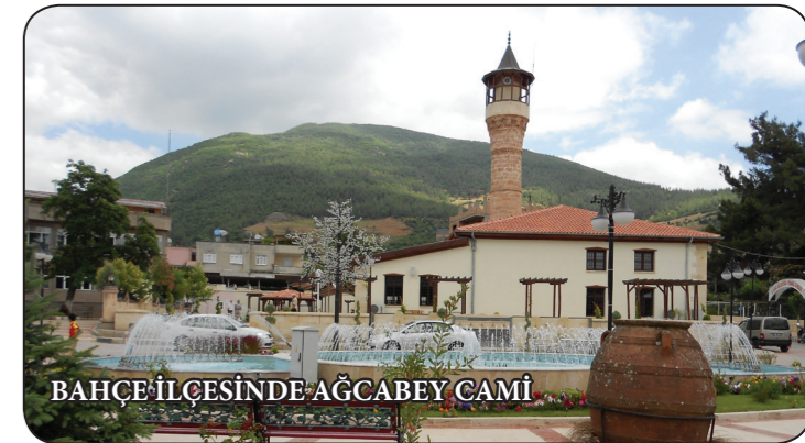
BAHÇE İLÇESİNDE AĞCABEY CAMİ