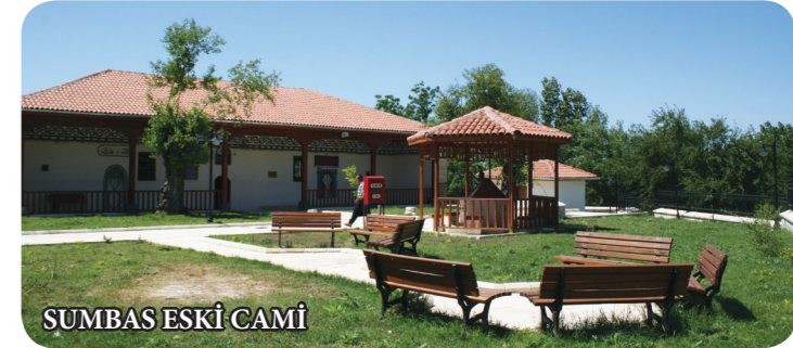
SUMBAS ESKİ CAMİ

Kadırlı ilçe merkezinde bulunan camii, Roma, Bizans ve Türk kültürünü bir arada yaşatan önemli bir eserdir. Romalılar tarafından Manastır, Bizanslılar tarafında kilise Dulkadiroğulları zamanında da cami olarak kullanılmıştır.