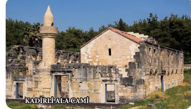
KADIRLI ALA CAMİ

Kadırlı ilçe merkezinde bulunan camii, Roma, Bizans ve Türk kültürünü bir arada yaşatan önemli bir eserdir. Romalılar tarafından Manastır, Bizanslılar tarafında kilise Dulkadiroğulları zamanında da cami olarak kullanılmıştır.