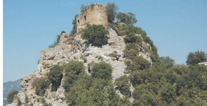
Kalealtı Kalesi-Kadiri İlçesi