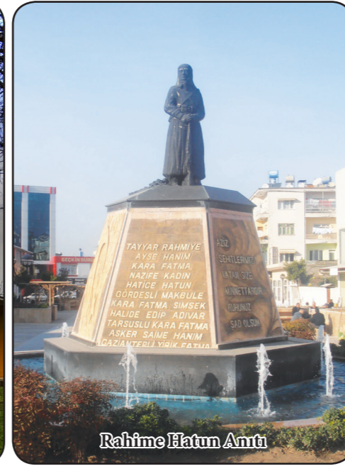
Rahime Hatun Anıtı